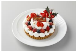
(ホテルオリジナル クリスマスケーキ)