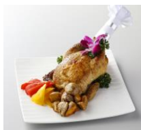
(丸鶏ローストチキン)