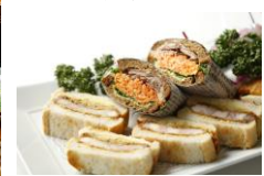
(サンドイッチ盛り合わせ)