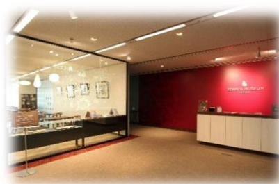
ゼンリンミュージアム 内観

販売開始日：2022年2月22日(火) 利用開始日：2022年3月1日(火) 運営：JR九州ステーションホテル小倉 URL： https://www.station-hotel.com/