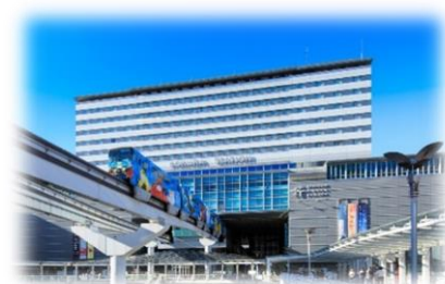
JR九州ステーションホテル小倉 外観

愛称：地図さんぽの部屋 企画：JR九州ステーションホテル小倉株式会社 株式会社ゼンリン 所在：15階 スタンダードツインルーム（1室限定） 期間：2022年3月1日(火)～2023年2月28日(火)