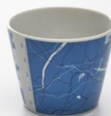
地図柄フリーカップ