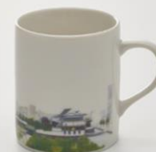
地図柄マグカップ