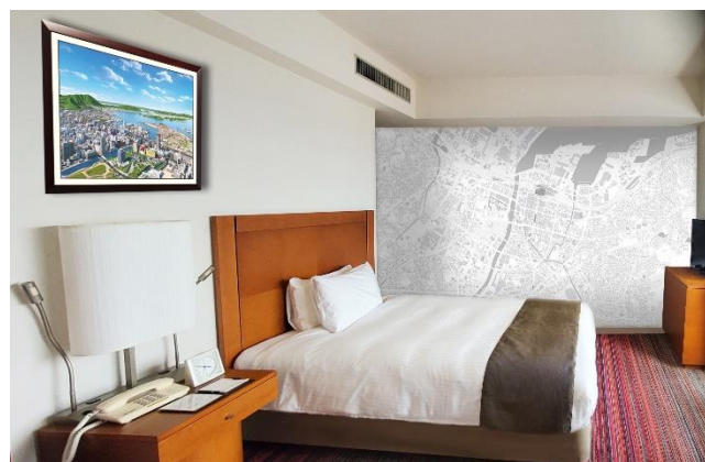
地図さんぽの部屋 イメージ