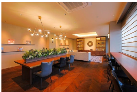
De La Gare