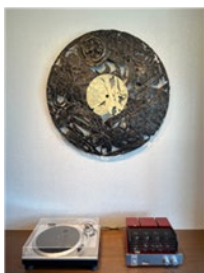
小沢氏作金属レリーフ